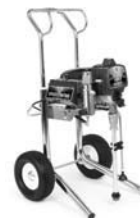
Ultra Max II 495 Hi-Boy 249917