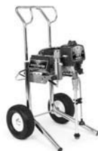
Ultra Max II 490 Hi-Boy 249914