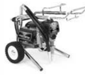
Ultra Max II 495 Lo-Boy 249916