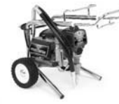
Ultra Max II 595 Lo-Boy 249918