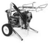
Ultra Max II 490 Lo-Boy 249913