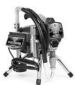
Ultra Max II 490 Stand 249911

Completo con Pistola Contractor™ II, Boquilla RAC X™ 515 y protector Manguera BlueMax II™ de 1/4 pulgadas x 50 pies