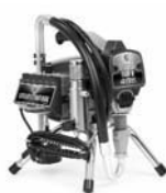
Ultra Max II 495 Stand 249915