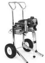
Ultra Max II 595 Hi-Boy 249919